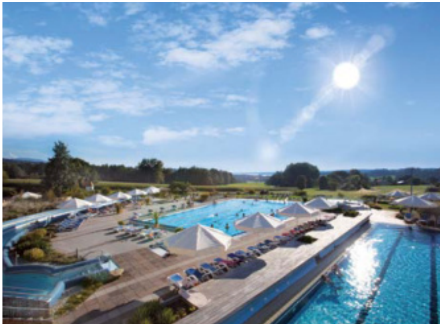
Chiemgau Thermen Bad Endorf