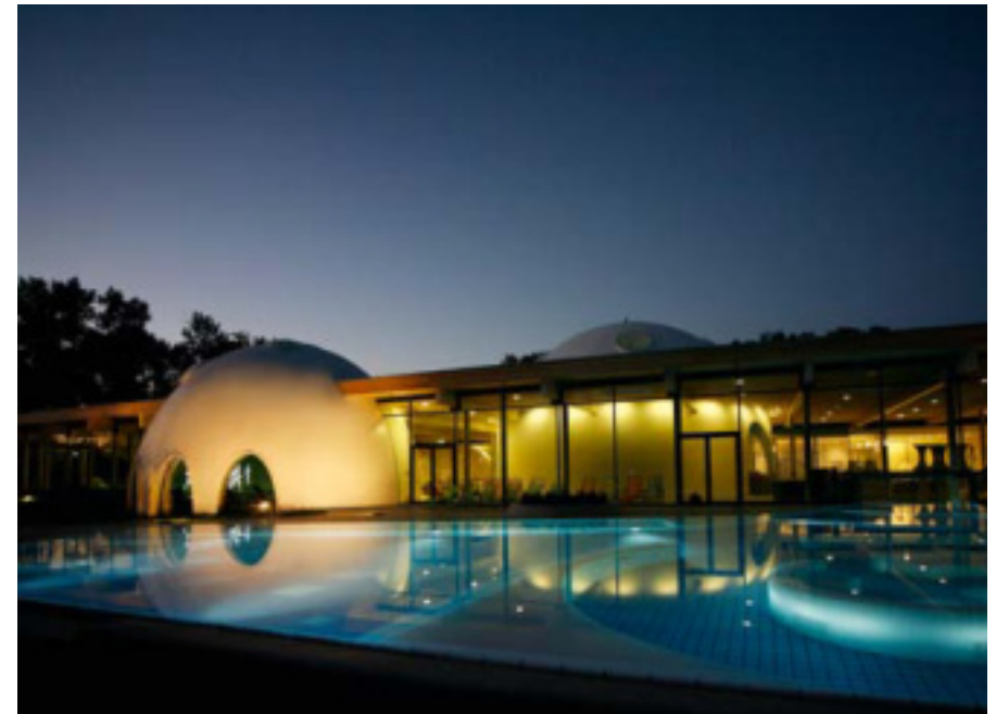
Therme Bad Aibling